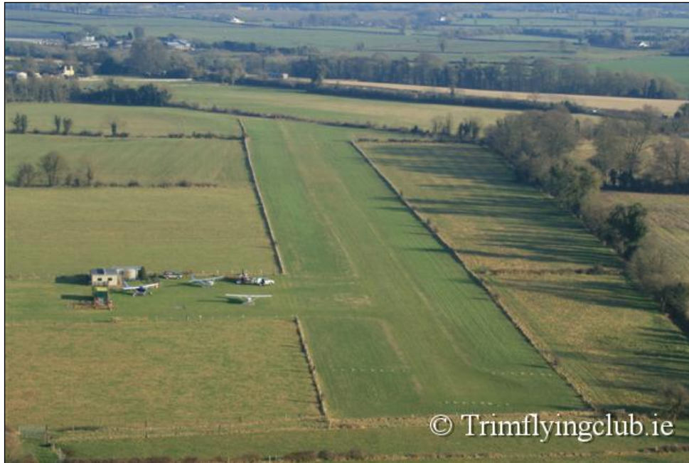
Fíor 12.1: Rúidbhealach Féir Aerpháirc Bhaile Átha Troim